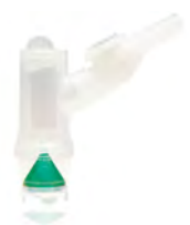
SALTER LABS Masques O2