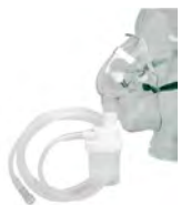
ASID BONZ Kits de nébulisation - pour les applications trachéobronchiales et alvéolaires

Le kit de nébulisation a été développé de façon particulièrement agréable pour le patient du point de vue de la manipulation. La fixation par bande élastique et la pince de nez permettent un port confortable en position verticale ou inclinée.