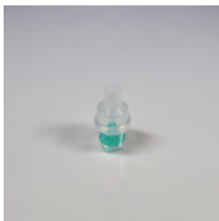
SALTER LABS Nébuliseur

Le nébuliseur haute densité (HDN) de Salter Labs convient à une utilisation efficace et efficace dans les hôpitaux et à domicile.