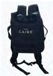
CAIRE AirSep Freestyle Comfort dac à dos